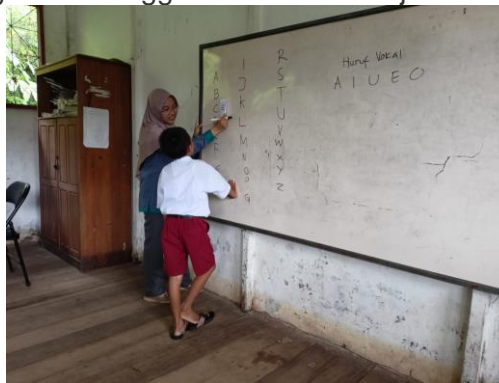
Gambar 3. Pengenalan huruf vokal

Kegiatan ini dilaksanakan di SDN Pilang 1 Kecamatan Jabiren Raya, Kabupaten Pulang Pisau. Kegiatan ini merupakan kegiatan pendampingan membaca untuk siswa kelas III SDN Pilang 1 oleh mahasiswa/i KKN MBKM IAIN Palangka Raya yang bertujuan untuk membantu siswa dalam mengatasi permasalahannya dalam keterampilan membaca permulaan. Dalam kegiatan pendampingan ini kami sebagai tim menggunakan metode eja untuk pendampingan membaca.