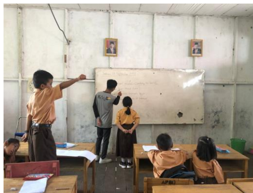
Gambar 4. Kegiatan siswa berlatih membaca

Pada pertemuan awal siswa diperkenalkan huruf-huruf vokal terlebih dahulu. Diajarkan bagaimana cara melafalkan huruf yang benar. Permasalahan yang banyak ditemukan bahwa siswa di kelas III ini masih merasa kesulitan dalam menyebutkan serta membedakan huruf vokal seperti huruf “o” “e” dan “u”.