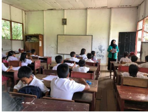
Gambar 2. Kegiatan pengenalan dan pembagian jadwal kegiatan