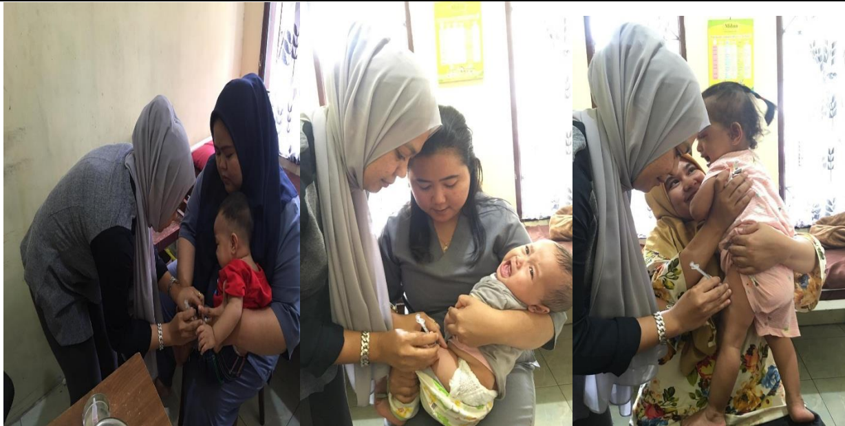
Gambar 2. Pemberian Imunisasi BCG