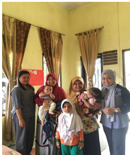
Gambar 3. Kegiatan Penuluhan (Promosi) Tentang Imunisasi BCG