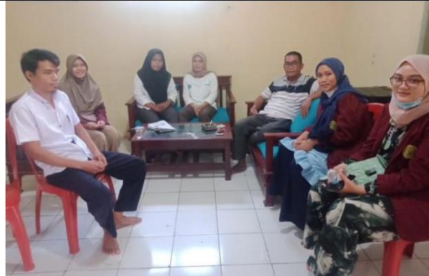
Gambar 2. Kegiatan observasi dan wawancara dengan kepala desa setempat