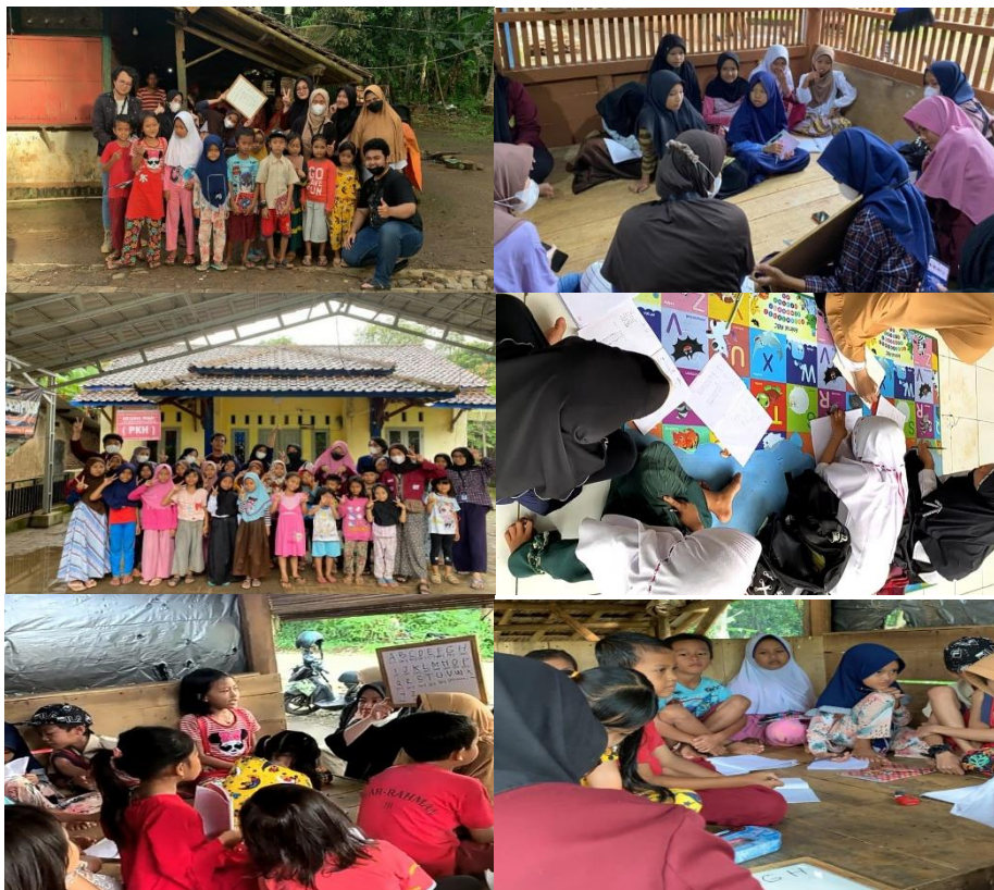
Gambar 3. Rangkaian pelaksanaan program "Kampung Literasi" di Desa Banyumekar