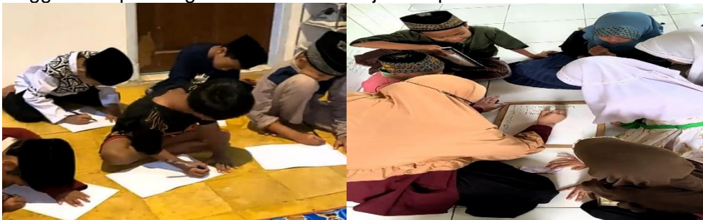
Gambar 4. Kegiatan evaluasi membaca dan menulis pada anak

mingguan menunjukkan bahwa adanya peningkatan atau kemajuan anak-anak dalam membaca dengan kategori tingkatan progress yang lambat hingga sedang. Hal ini dijadikan sebagai evaluasi untuk pembelajaran di minggu berikutnya sehingga perkembangan membaca anak-anak semakin meningkat. Tim menyampaikan metode pembelajaran dengan memberikan bacaan bergambar sehingga memotivasi anak-anak untuk membaca. Di setiap pendampingan pembelajaran disisipi juga permainan-permainan seperti tebak huruf dan kata agar mengantisipasi anak-anak tidak mengalami kebosanan dalam belajar. Pada minggu kedua dilakukan evaluasi, anak-anak sudah mampu mengenal huruf dan membaca dengan baik selanjutnya pada minggu ketiga, anak-anak sudah mulai diajarkan untuk menulis kata demi kata sesuai dengan ejaan anak-anak. Evaluasi berikutnya dilakukan pada minggu ketiga menunjukkan kemajuan kemampuan menulis anak-anak tidak begitu signifikan sehingga dilakukan perbaikan metode pembelajaran pada minggu berikutnya. Kegiatan pendampingan literasi membaca dan menulis dilakukan sampai akhir bulan berjalan tim melakukan evaluasi pada minggu keempat. Kegiatan evaluasi ditunjukkan pada Gambar 4.