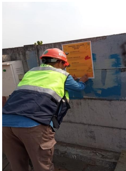
Gambar 2. Pemasangan poster mengenai Sosialisasi Alat pelindung Diri