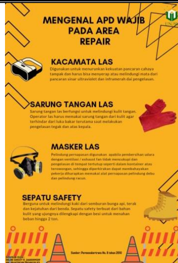
Gambar 1. Poster mengenai sosialisasi Alat Pelindung Diri