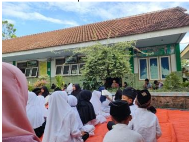
Gambar 6. Kegiatan keagamaan di Halaman Sekolah

Tidak terdapatnya tempat ibadah di sekolah tersebut. Apabila terdapat kegiatan keagamaan sekolah melakukan beberapa opsi, yakni apabila kegiatan dilaksanakan dengan jumlah peserta yang sedikit, kegiatan keagamaan dialihkan ke ruang perpustakaan, seperti halnya dengan shalat wajib yang dilaksanakan oleh guru, mengaji oleh beberapa siswa. Dan apabila kegiatan keagamaan dilaksanakan dengan jumlah peserta yang banyak, kegiatan keagamaan akan dilaksanakan di lapangan sekolah dengan dialaskan oleh spanduk bekas.