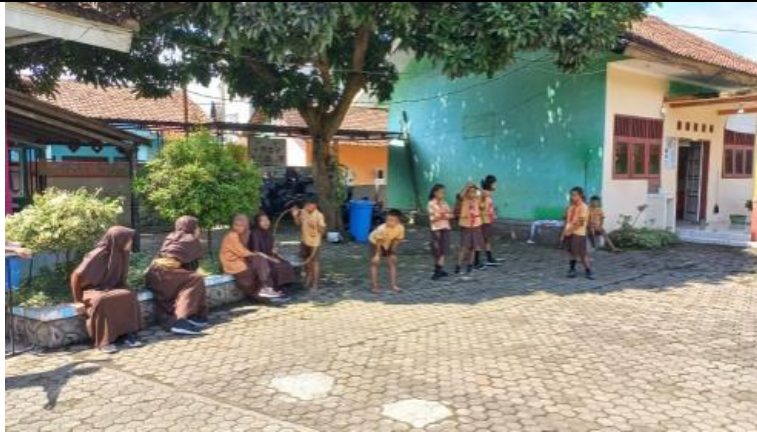
Gambar 5. Halaman sekolah

Terdapat beberapa prasarana yang tidak dimiliki oleh sekolah tersebut, seperti halnya tempat ibadah dan ruang laboratorium sekolah. Sekolah ini tidak memiliki laboratorium computer. Laboratorium computer adalah ruangan di sekolah yang didesain khusus untuk belajar tentang computer, teknologi informasi dan jaringan. Fungsi utama laboratorium adalah untuk memberikan pelajar dan mahasiswa dengan keterampilan teknis terkait dengan computer, menulis laporan, mencari informasi di internet, dan membuat presentasi, laboratorium computer juga dapat menjadi tempat bagi siswa untuk belajar tentang teknologi informasi, jaringan dan kerja tim. Dengan memiliki akses ke computer yang memadai dan jaringan yang baik, siswa dapat belajar tentang bagaimana cara menggunakan dan memprogram computer.