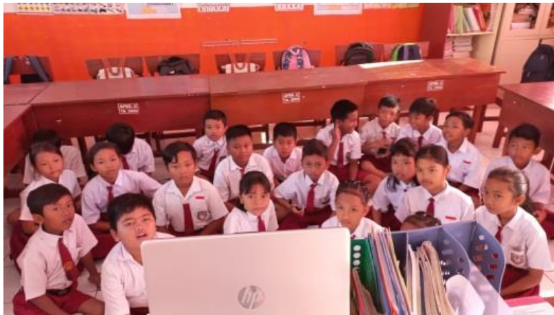
Gambar 2 Pembelajaran menggunakan media

sarana dan prasarana sekolah. Pada Bab VII Pasal 24 PP 32/2013 ada beberapa hal dalam standart sarana dan prasarana sekolah yang belum di miliki oleh SDN 3 Singotrunan. Dalam satuan pendidikan wajib memiliki sarana sebagai penunjang pembelajaran siswa, sekolah tersebut memiliki perabot pendidikan seperti lemari di setiap kelas yang berfungsi sebagai tempat penyimpanan pembelajaran siswa, memiliki peralatan pendidikan seperti wifi sekolah, computer sekolah dan hal lainnya. Dalam media pendidikan, sekolah ini telah memiliki target untuk mempunyai layar proyektor yang dimiliki oleh semua kelas, namun untuk saat ini masih memiliki 2 buah layar proyektor. Dalam proses pembelajaran, apabila siswa membutuhkan layar proyektor dalam menunjang pembelajaran, guru harus bergantian dalam menggunakannya. Adapun ketika peneliti ke sekolah tersebut, jika peneliti ingin memberikan pembelajaran menggunakan media pendidikan, peneliti menggunakan laptop pribadi dan mengumpulkan siswa dalam satu tempat agar siswa dapat melihat materi yang disampaikan.