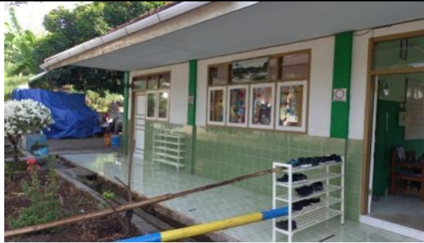
Gambar 3 Ruang kelas yang mengalami kebocoran saat hujan

Kondisi kelas yang baik adalah kondisi ruangan yang memadai dan seimbang dengan rasio yang tepat. Hal tersebut dapat berpengaruh pada proses pembelajaran siswa. Prasarana yang seharusnya dimiliki oleh satuan pendidikan adalah ruang pimpinan. SDN 3 Singotrunan memiliki ruang kepala sekolah yang berada dalam satu atap dengan ruang guru dan ruang tamu. Dalam satu ruangan, ruang kepala sekolah berada didalam ruang tersebut namun hanya dibatasi oleh tembok dan pintu. Didalam satu ruangan itu pul terdapat ruang guru dan ruang tamu. Hal ini tidak termasuk dalam standart prasarana satuan pendidikan. Seharusnya ruang guru, ruang kepala sekolah dan ruang tamu memiliki tempat yang terpisah. Dimana fungsi dari ruangan yang berbeda ini, guru akan lebih fokus dalam mengerjakan tugas sekolah, tidak terganggu oleh tamu apabila datang. Didalam satu ruangan tersebut terdapat satu meja kursi computer yang berfungsi sebagai computer sekolah. Sekolah tersebut tidak memiliki ruang tata usaha dan pegaai tata usaha seolah. Pengadministrasian sekolah dilaksanakan oleh guru pengajar. Sehingga, guru memiliki peran ganda sebagai guru pengajar dan tenaga tata usaha sekolah pula. Keterbatasan tenaga pegawai yang menjadikan peran ganda pada guru.