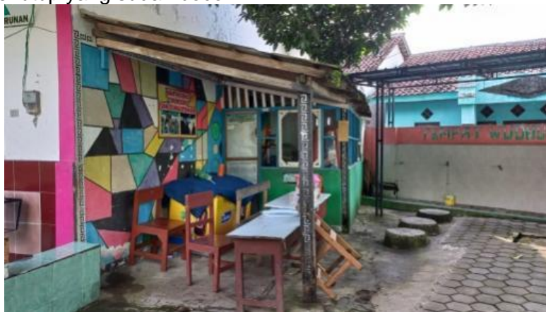
Gambar 4. Kantin sekolah

Adapun dengan ruang kantin berada di dekat parkir kendaraan sekolah. Namun, kantin ini memerlukan perbaikan karena kantin tersebut hany terbut dari meja yang digabungkan saja dengan atasnya terdapat penutup yang sudah bocor.