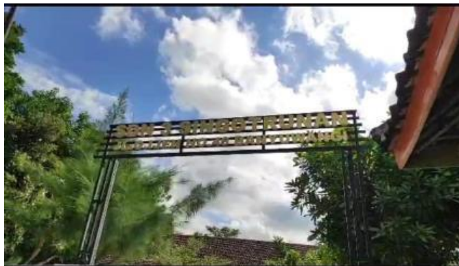
Gambar 1 SDN 3 Singotrunan Banyuwangi

Sekolah Dasar Negeri (SDN) 3 Singotrunan merupakan sekolah dasar negeri yang berada dibawah pengawasan Dinas Pendidikan Kabupaten Banyuwangi. SDN 3 Singotrunan terletak di Jl. Gunung Ijen No. 46, Kelurahan Singotrunan, Kecamatan Banyuwangi, Kabupaten Banyuwangi, Jawa Timur 68414.