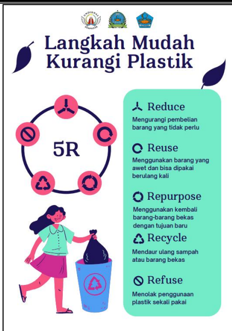
Gambar 4. Prototype Brosur