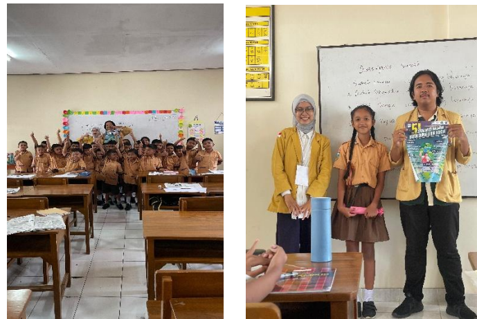
Gambar 3. Melakukan Kegiatan Edukasi Di SD Negeri 01 Sanur