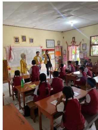
Gambar 1. Melakukan Kegiatan Edukasi Di SD Negeri 11 Sanur