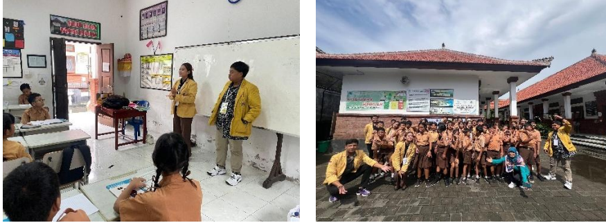
Gambar 2. Melakukan Kegiatan Edukasi Di SD Negeri 03 Sanur