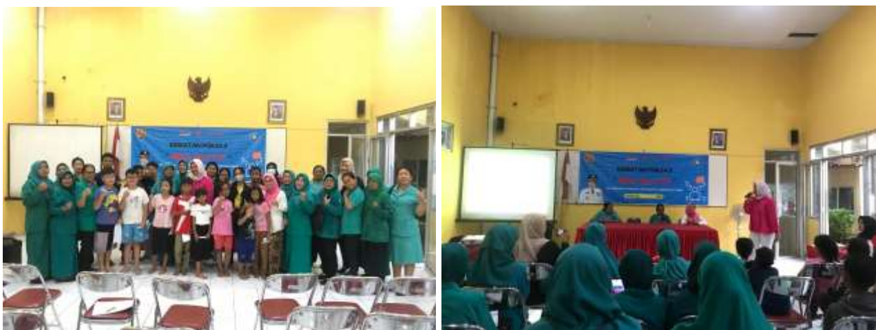
Gambar 2. Pelaksanaan Kegiatan Pendampingan Remaja Tentang Who Am I

Pembahasan hasil-hasil ini menunjukkan bahwa pendampingan pengenalan diri memiliki dampak yang positif dan signifikan pada perkembangan remaja di Kecamatan Bugangan. Faktor-faktor seperti dukungan emosional, aktivitas reflektif, dan bimbingan yang terstruktur memainkan peran penting dalam keberhasilan program ini. Namun, untuk mencapai hasil yang lebih optimal, perlu adanya kesinambungan dan pengembangan program yang lebih komprehensif serta kolaborasi yang lebih erat antara berbagai pihak terkait, termasuk keluarga, sekolah, dan komunitas. Secara keseluruhan, hasil dari pendampingan pengenalan diri pada remaja di Kecamatan Bugangan menunjukkan bahwa dengan pendekatan yang tepat, remaja dapat dibantu untuk mengembangkan identitas yang kuat, percaya diri, dan siap menghadapi masa depan dengan lebih baik. Pembahasan ini menekankan pentingnya melanjutkan dan mengembangkan upaya pendampingan ini untuk mencapai dampak yang lebih luas dan berkelanjutan.