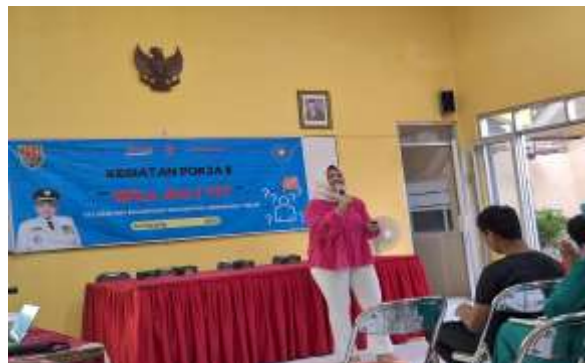
Gambar 1. Pelaksanaan Pendampingan Remaja Tentang Who Am I

membuat keputusan yang lebih tepat dan relevan dengan diri mereka sendiri. Selain itu, pendampingan bertujuan untuk mengembangkan rasa percaya diri yang kuat, memungkinkan remaja menghadapi berbagai tantangan hidup dan tekanan dari lingkungan sekitar dengan lebih baik.