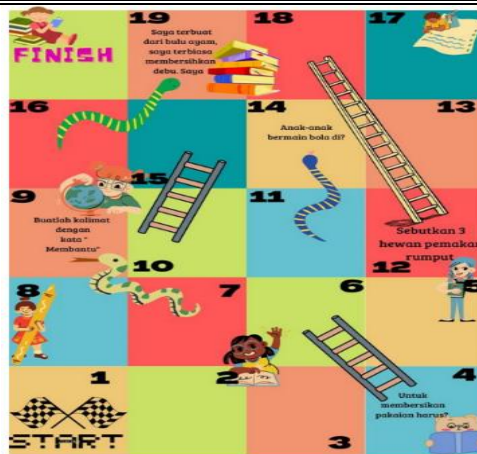
Gambar 2 Media Ular Tangga