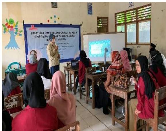
Gambar 1 Pemaparan Materi

Pada tahap pelaksanaan kegiatan ini dimulai dari pemaparan teori terkait pengembangan media pembelajaran, kemudian pendampingan kepada pendidik dalam mendesain dan mengembangkan media pembelajaran.