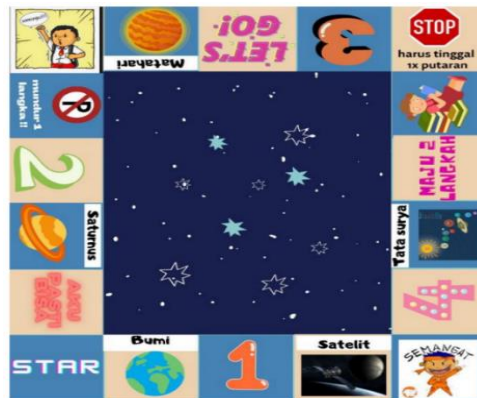
Gambar 3 Media Monopoli

Setelah pendidik dibekali teori terkait media pembelajaran, kemudian pendidik melakukan praktik langsung untuk membuat media pembelajaran sesuai mata pelajaran yang diampu. Para pendidik didampingi dan dibimbing untuk membuat media pembelajaran. Pendidik membuat rancangan atau rencana media yang akan dikembangkan disesuaikan dengan kebutuhan media pembelajaran terhadap permasalahan pembelajaran yang dihadapi pada masing-masing sekolah.