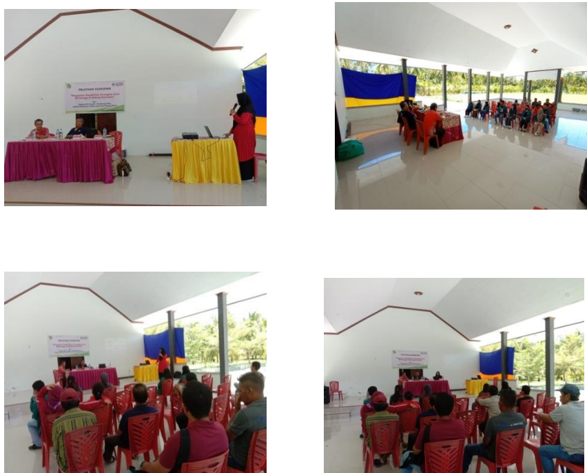
Gambar 2. Suasana Kegiatan PKM

Berdasarkan hasil diskusi, bahwa penataan arsip pemerintah desa yang selama ini dilakukan oleh Aparat Desa Patiwunga masih belum optimal. Pencatatan data dan informasi pada buku Administrasi desa belum konsisten dilakukan, klasifikasi atau pengelompokan arsip belum sepenuhnya dilakukan sesuai dengan kode klasifikasi, penyimpanan arsip pemerintah desa masih bercampur dengan alat tulis kantor dan barang-barang lainnya dalam sebuah lemari.