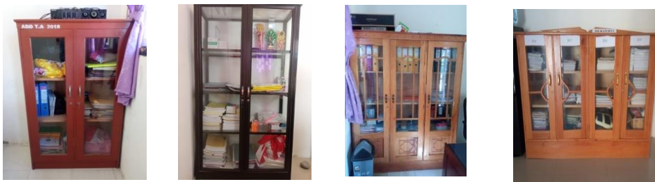
Gambar 1. Lemari Arsip di Kantor Desa Patiwunga

Berdasarkan hal tersebut maka kami tertarik untuk melakukan kegiatan pelatihan penataan arsip pemerintah desa bagi aparat Desa Patiwunga Kecamatan Poso Pesisir Selatan Kabupaten Poso agar khalayak sasaran dapat menata arsip administrasi desa dengan optimal.